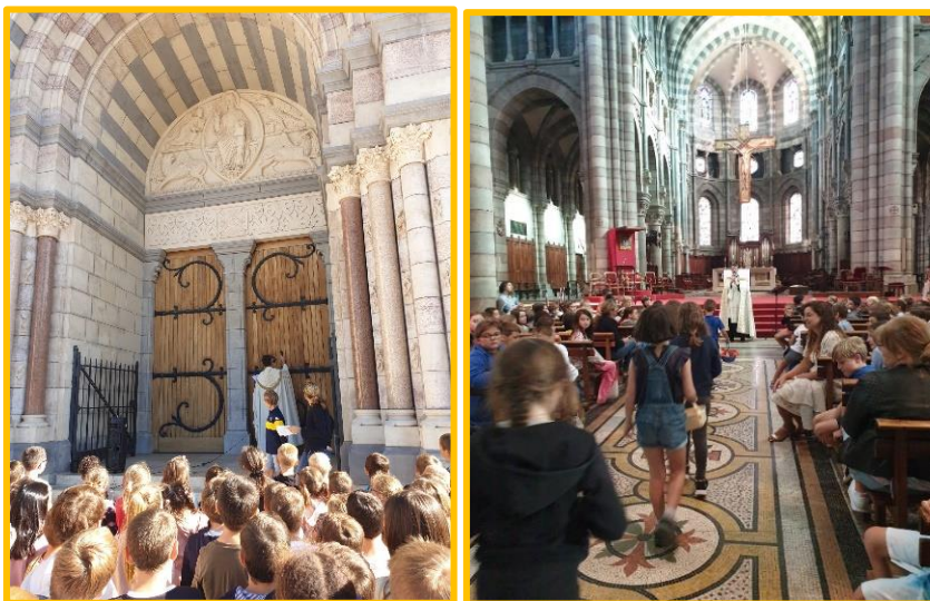
La célébration de Rentrée