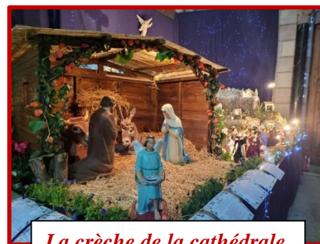
La crèche de la cathédrale

de la part de toute la communauté éducative !