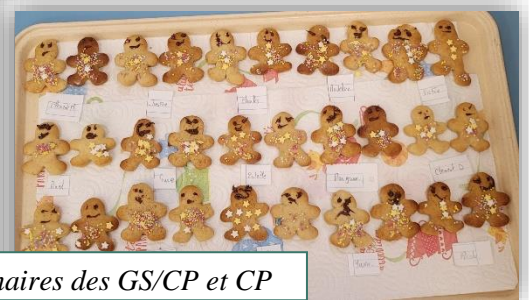
Créations culinaires des GS/CP et CP