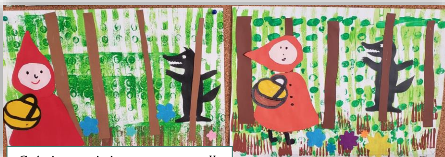
Créations artistiques en maternelle